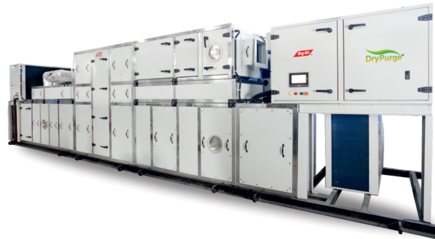
百瑞已成功地使用单转轮满足露点低于-75℃的严格要求。

百瑞拥有与干燥房相关的产品和全球标准技术。绿色DryPurge®(GDP)除湿机技术是百瑞(亚洲)专利技术,对于相对湿度小于1%的干燥房,是非常高节能的除湿机。