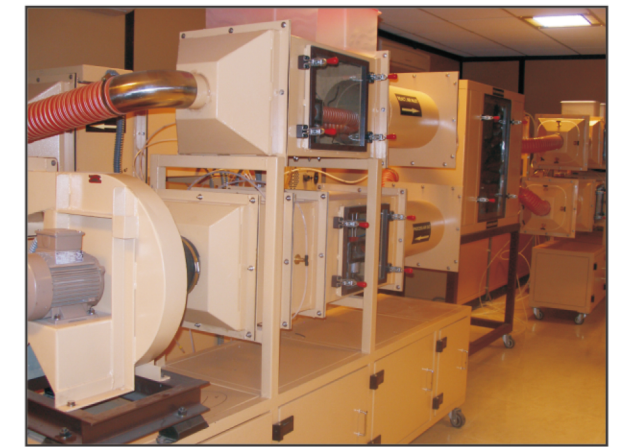
实验室用于主动再生及被动再生转轮